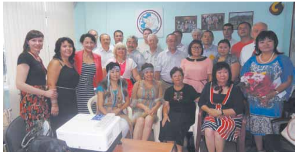
• Первая фотография в новом центре.