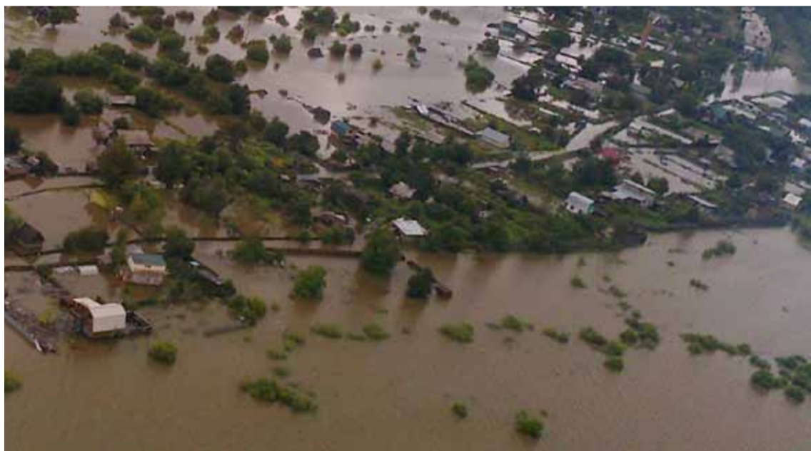
• Под водой скрывались целые деревни и поселки...

Первой в Хабаровском крае попала под удар стихии сама дальневосточная столица, поэтому основные силы были брошены на защиту Хабаровска.